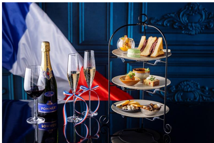
夏のハイティー ※写真はイメージです